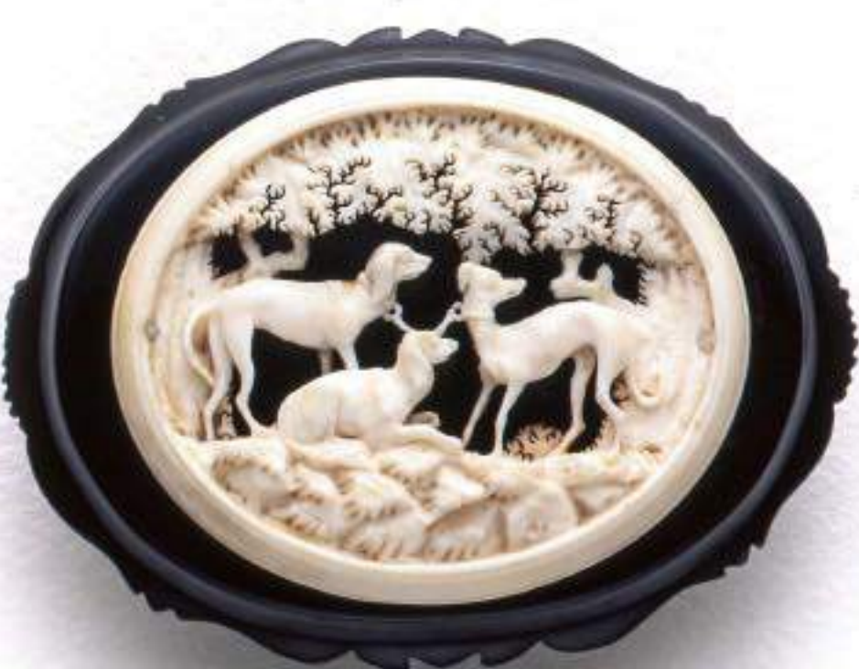
アイボリー&ジェットブローチ 19世紀中期 イギリス 種葉アンティークジュエリー美術館所蔵