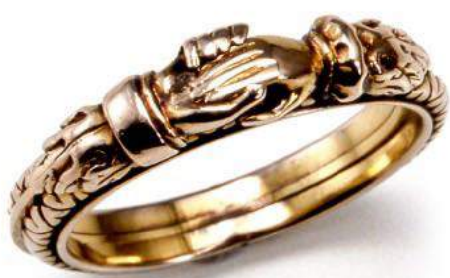
リング「忠実」 Gold Fede Ring 18世紀後期 イギリス 種葉アンティークジュエリー美術館所蔵