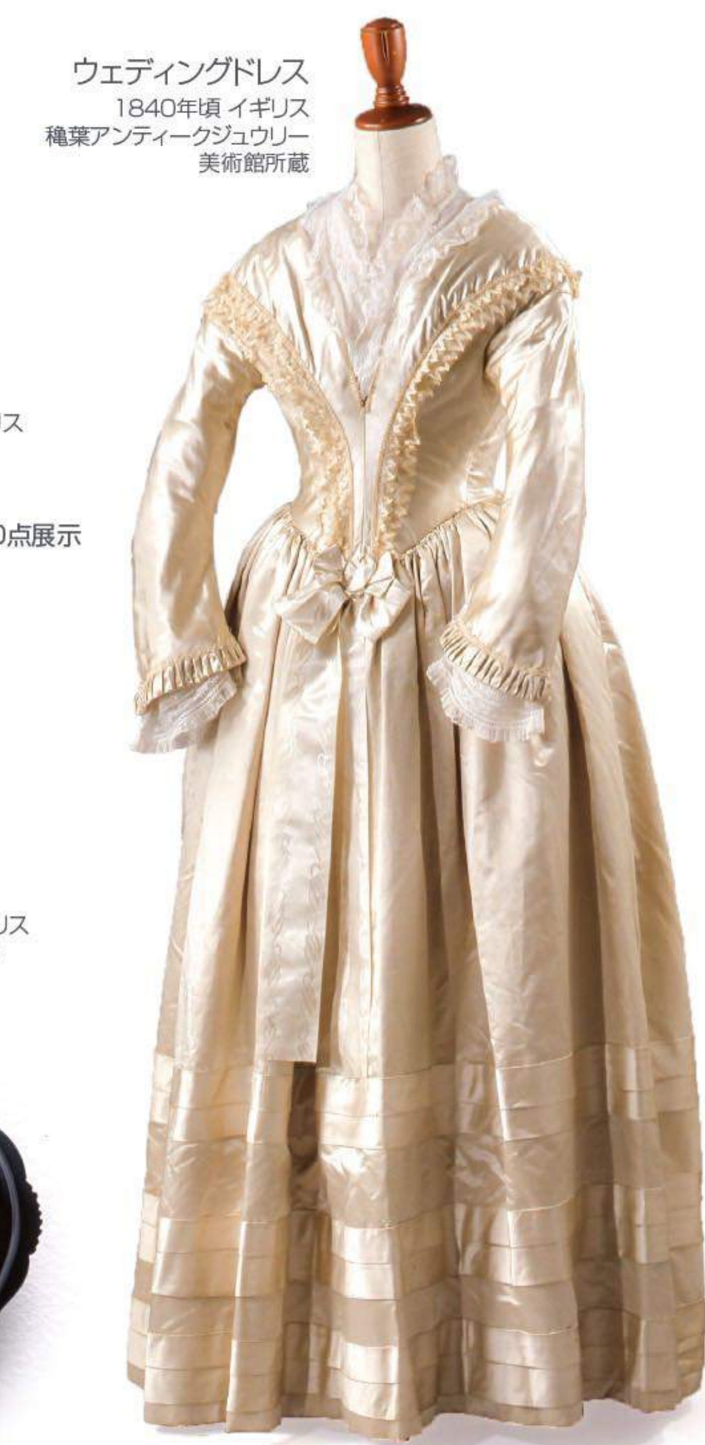
ウェディングドレス 1840年頃 イギリス 種葉アンティークジュエリー 美術館所蔵