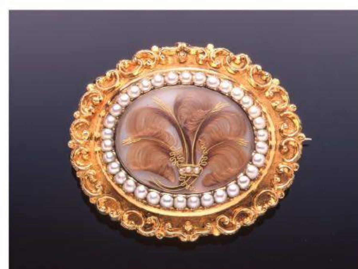
ヘアー&ゴールドブローチ Hair and Gold Brooch 1858年 イギリス 種葉アンティークジュエリー美術館所蔵