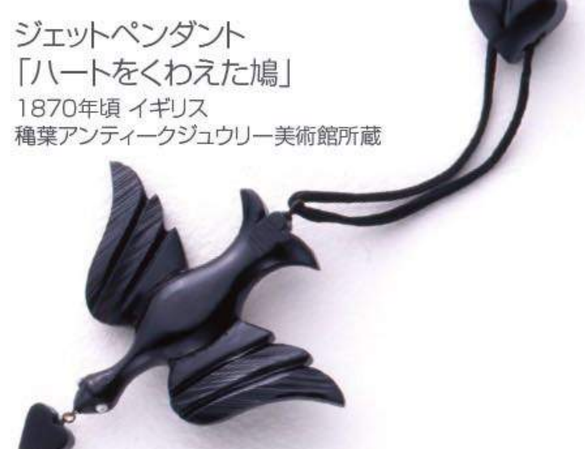
ジェットペンダント 「ハートをくわえた鳩」 1870年頃 イギリス 種葉アンティークジュエリー美術館所蔵